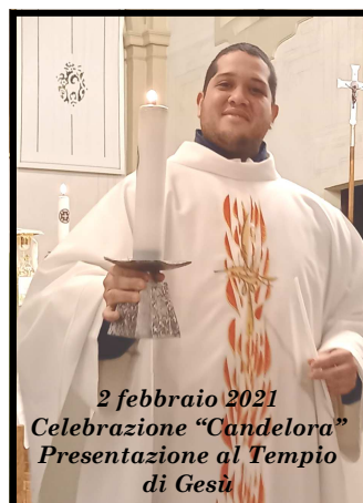
2 febbraio 2021 Celebrazione "Candelora" Presentazione al Tempio di Gesù

euro e li diede a quel pagliaccio poi Giovanni tornò a casa, contentissimo... Il ragazzo pensava che tutto quello fosse il circo. Aveva visto solo la parata, ma non aveva visto la meravigliosa esibizione che avrebbe avuto luogo sotto la tenda. A volte anche a noi capita di comportarci allo stesso modo di Giovanni con le cose di Dio. Quante volte abbiamo scambiato Dio per il nostro vuoto spirituale e il nostro bisogno di riempirlo con qualche cosa veloce, e come il bambino che voleva vedere il circo ci siamo accontentati del colore e dell'eccitazione della parata, ma non siamo entrati nella tenda del suo amore o nel profondo del suo cuore; non abbiamo scalato la montagna dove Dio è trasfigurato; e, più giocoleria facciamo, più Dio è sempre più grande di noi, Dio è il mistero che ci avvolge e ci ama. Mentre attraversiamo il "deserto" Quaresimale teniamo lo sguardo rivolto alla Pasqua, che è la vittoria definitiva di Gesù contro il Maligno, contro il peccato e contro la morte.